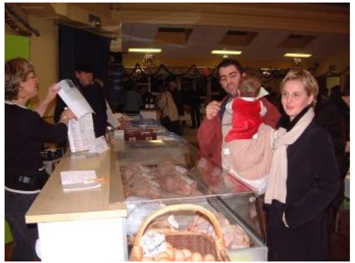
Vendredi 16 Décembre, c'était le marché de Noël. Les exposants ont accueilli les nombreux manémontais qui, déjà, préparaient Noël.