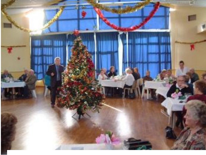
Samedi 3 Décembre, le repas de Noël a rassemblé les anciens du village.