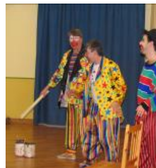
Le spectacle de clowns prévu le mercredi 21 décembre a été reporté au mercredi 11 janvier 2006....