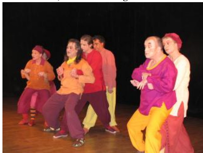
Coté scène, le médecin malgré lui