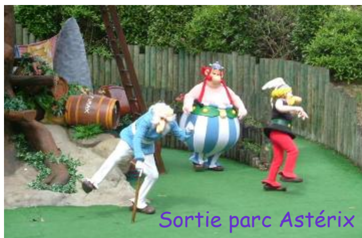
Sortie parc Astérix