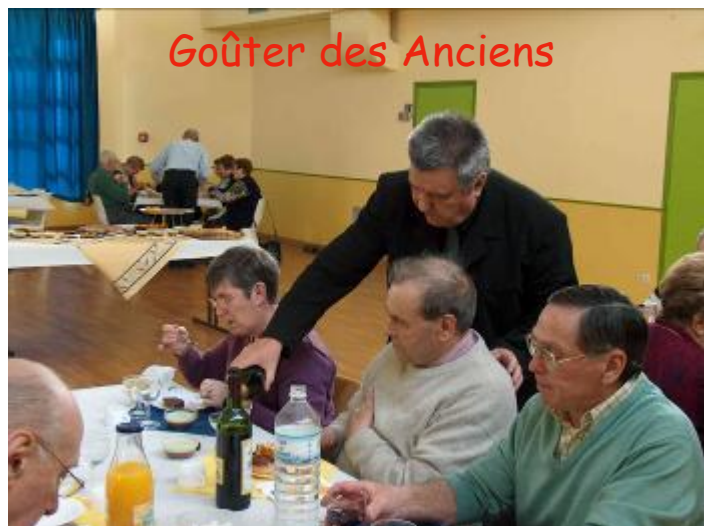
Goûter des Anciens