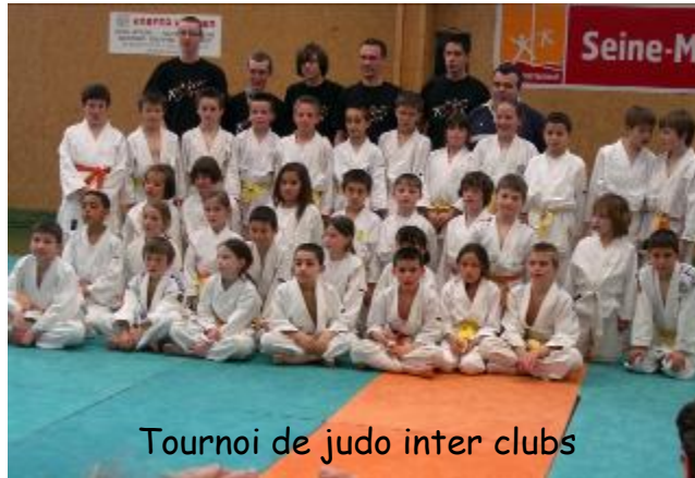
Tournoi de judo inter clubs