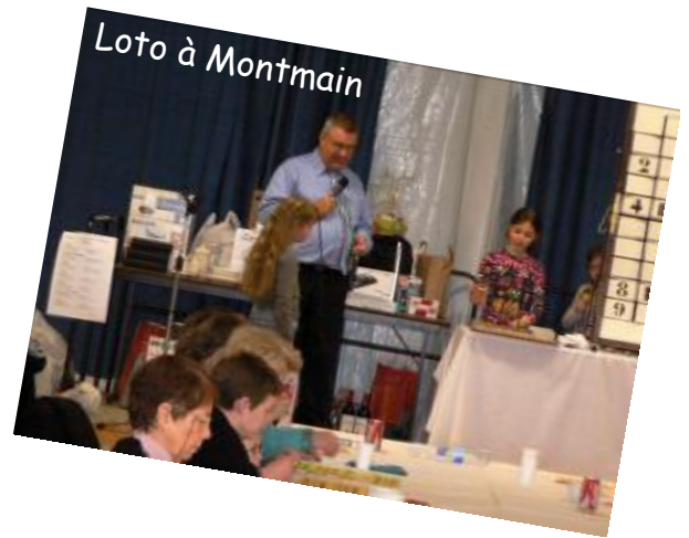
Loto à Montmain