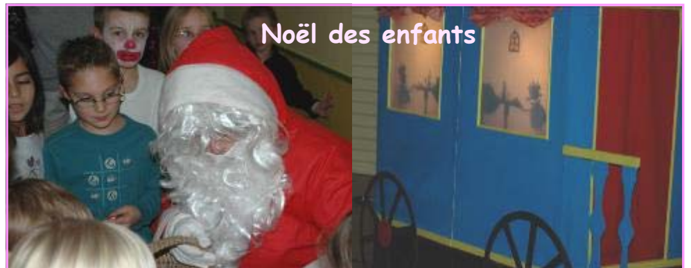
Noël des enfants