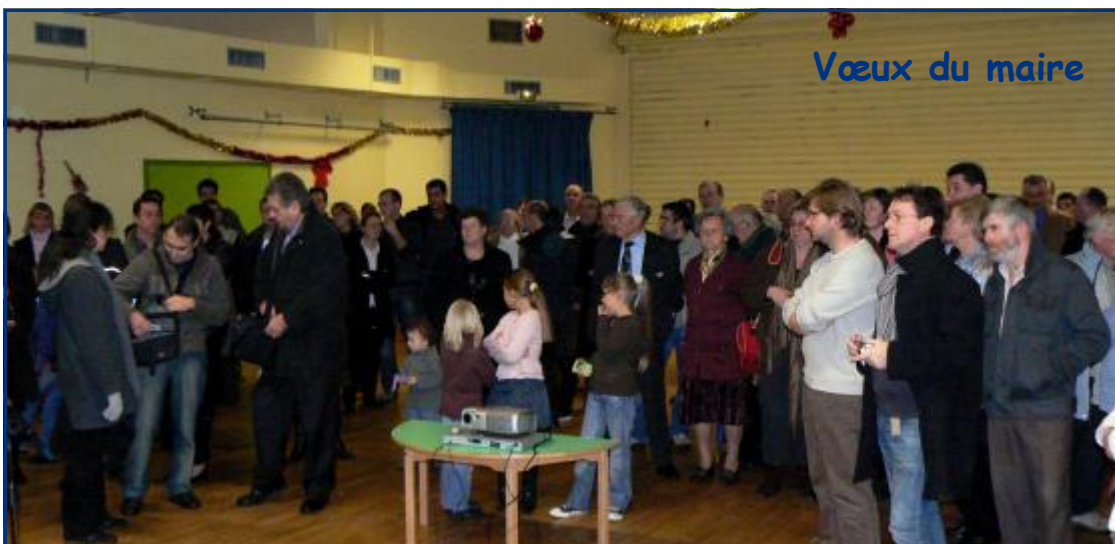
Vœux du maire