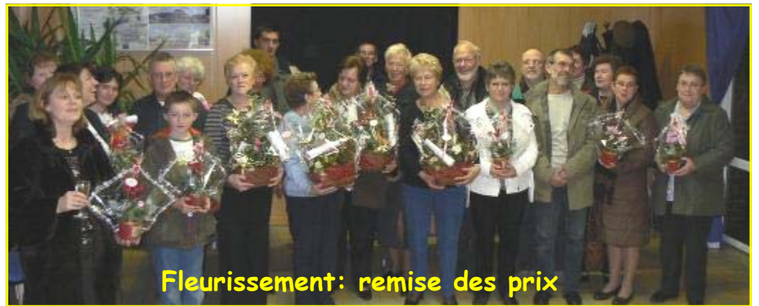
Fleurissement: remise des prix